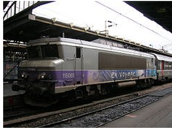
BB15000 : 30 ans problèmes de tension sur réseau PSL