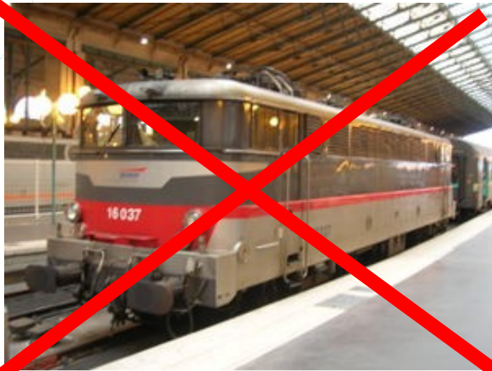
BB16000 : 50 ans remplacées