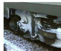
Mécanismes obstrués et câbles gelés sous la caisse d'un train